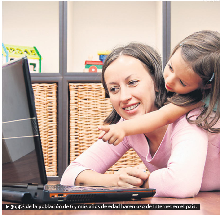
► 36,4% de la población de 6 y más años de edad hacen uso de Internet en el país.